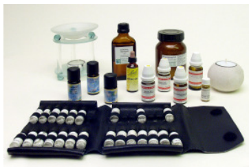
Komplementär- medizinische Therapie

Sie entscheiden, was für Sie am besten ist. Wenn Sie unschlüssig sind, beraten Sie Hebamme und Arzt/Ärztin gerne.