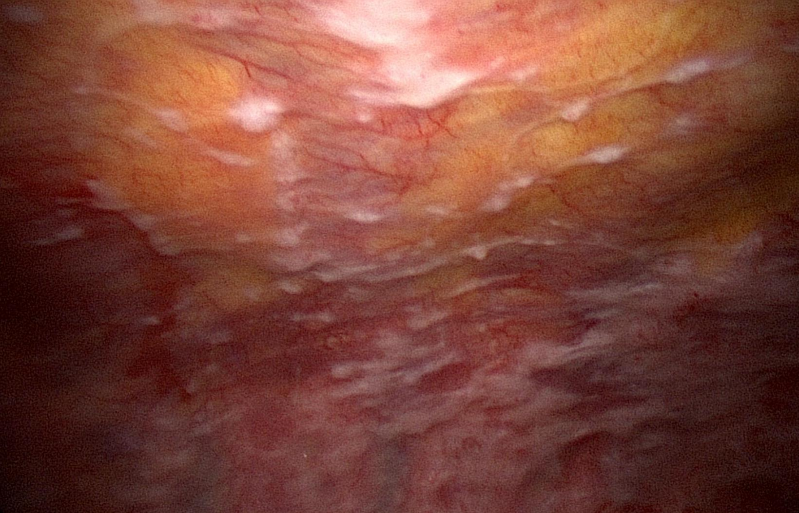
Brustkorbspiegelung (Thorakoskopie). Zahlreiche weissliche Auflagerungen auf dem Brustfell (Pleura). Histologie: Pleuramesotheliom.