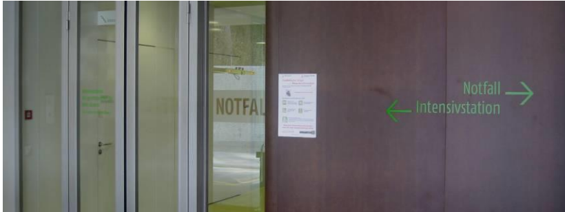
Spitaleingang Notfallstation / Intensivstation