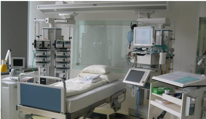
Leerer Bettenplatz auf der Intensivstation

Auf der rechten Seite des Fotos steht der Überwachungsmonitor und das Beatmungsgerät, ausserdem der Schreibtisch für die Dokumentation durch das Behandlungsteam. Auf der linken Seite sind Spritzen- und Infusionspumpen angebracht, mit denen Medikamente fein dosiert gegeben werden können. Ausserdem ist dort der Nachttisch für persönliche Utensilien der Patientinnen und Partienten sowie der Möglichkeit TV zu sehen oder zu telefonieren.