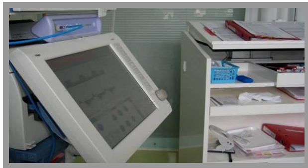
Blick zur linken Seite (Beatmungsgerät)