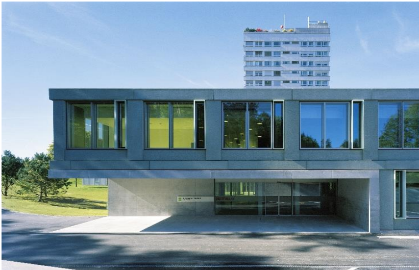
Intensivstation Kantonsspital Frauenfeld