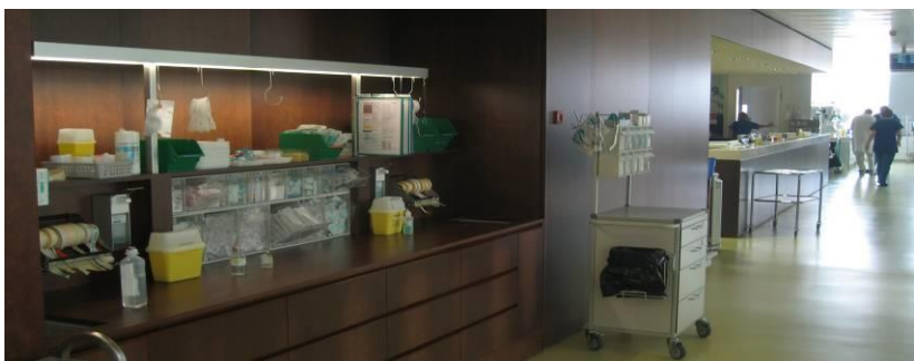
Intensivstation: Zentraler Arbeitsplatz vor den Patientenzimmern