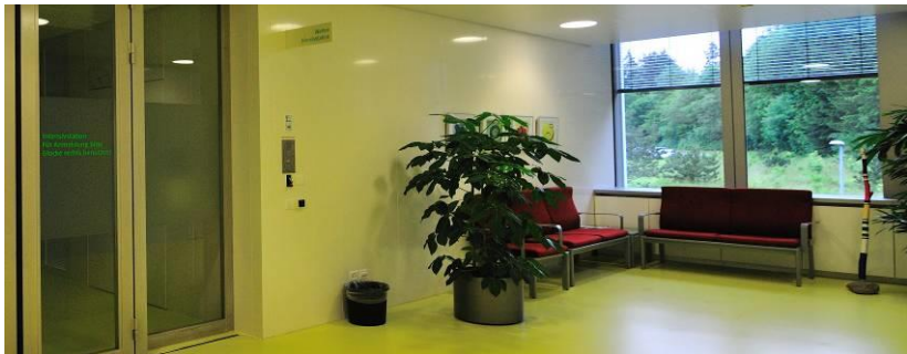
Besucherzugang und Wartezone zur Intensivstation