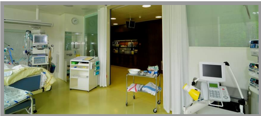
Blick aus dem Patientenzimmer zum zentralen Arbeitsplatz