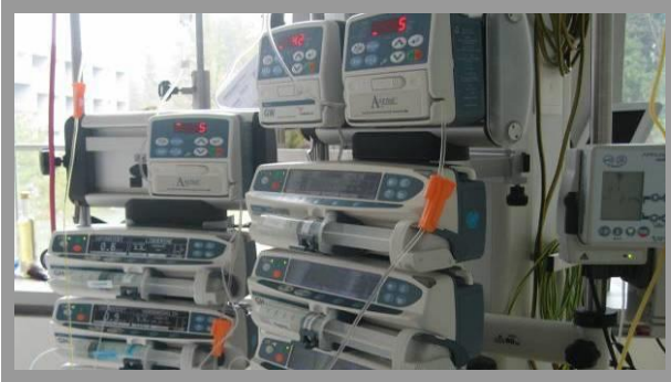
Blick zur rechten Seite (Infusionen)