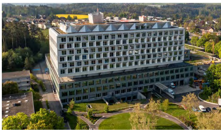
Das Kantonsspital Frauenfeld ist heute eines der modernsten Spitäler der Schweiz.

Norbert Vetterli: «24 ehrbare Handwerker, Meister und Gesellen gründeten damals einen Ersparnisfonds. Die Gesellen zahlten für jede Woche drei Kreuzer in eine Lade mit zwei Schlössern; einen Schlüssel verwahrte der