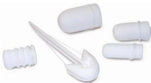
Verschiedene Wegwerfpessare und Tampons.

Führen vorübergehende Pessarbehandlungen nicht zur Heilung der Senkungs- und Inkontinenzbeschwerden, so ist meistens eine Operation notwendig. Die Vorbehandlung mit Pessaren und Östrogencremen kräftigt das Gewebe, was die Operation erleichtert und den operativen Heilerfolg verbessert.