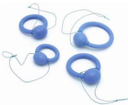
Urethrapessare (Ring mit Keule)

Ringpessare, meistens verstärkt durch eine Keule (Urethrapessare), helfen besonders bei Belastungsinkontinenz, Reizblasen und Kohabitationsbeschwerden. Sie werden entweder nur bei sportlicher Belastung oder aber den ganzen Tag getragen. Der Faden wird beidseits der Keule befestigt. Dies erleichtert das Herausziehen des Pessars und stabilisiert die Keule unter der Harnröhre.