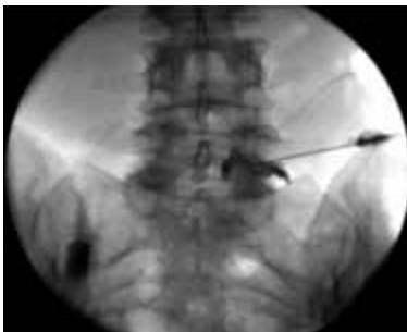
→ Infiltration bei Bandscheibenproblemen